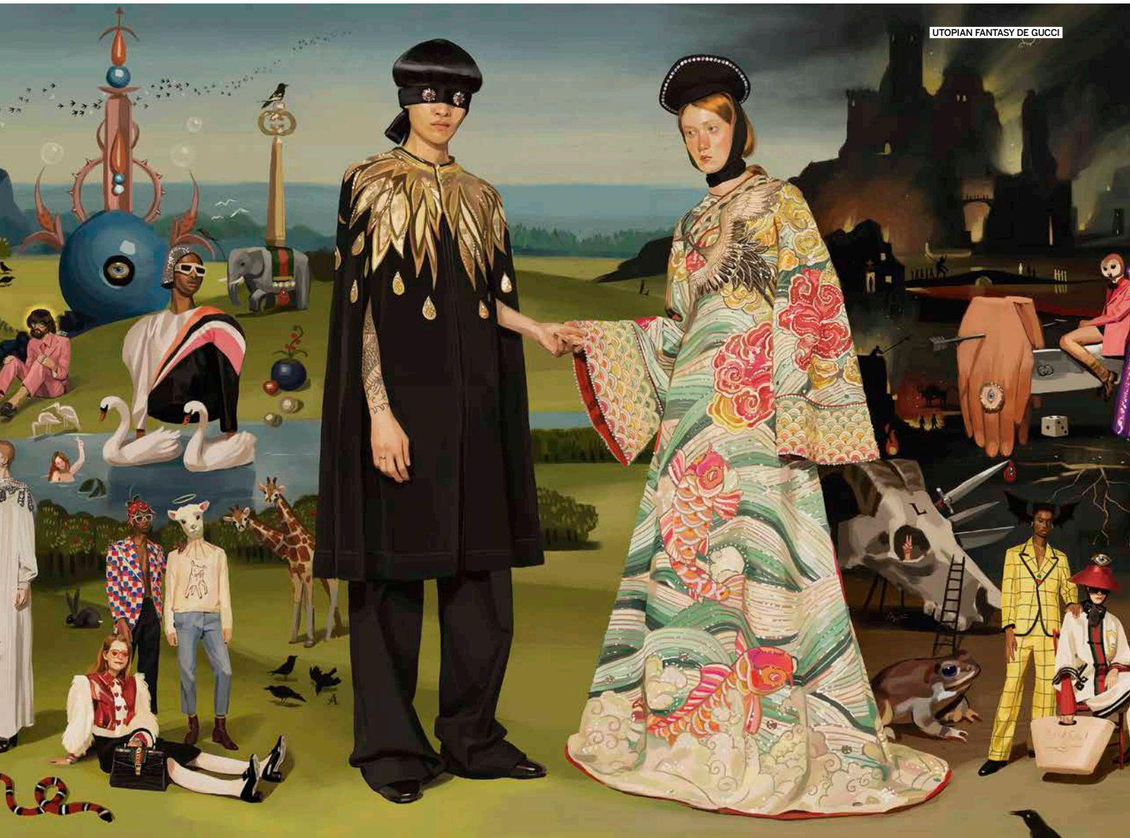
UTOPIAN FANTASY DE GUCCI