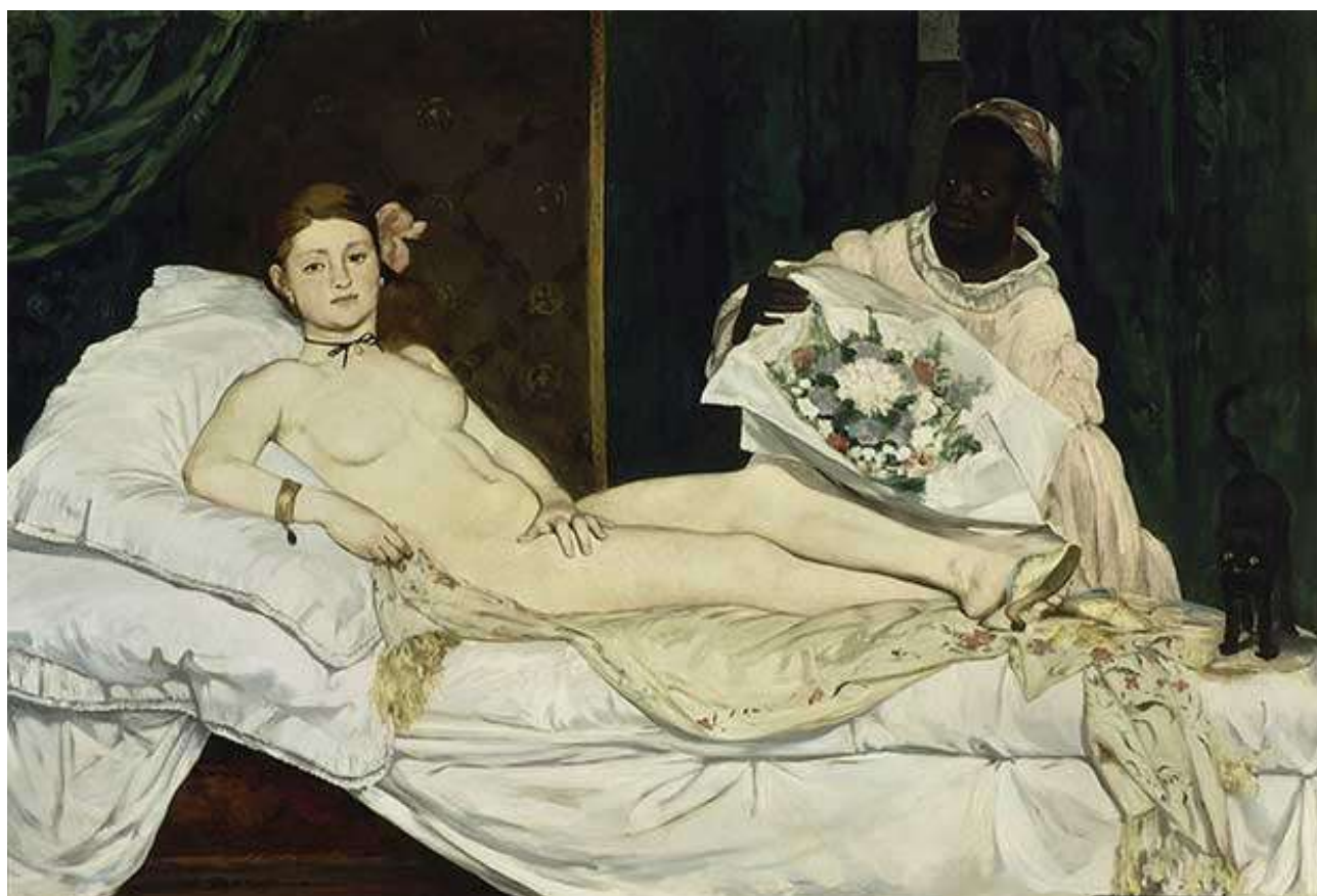
Édouard Manet, Olympia , 1863, huile sur toile, 130 x 190 cm, musée d'Orsay

Enfin une exposition qui ravit les amoureux d'art et de félin. De la sculpture représentant la déesse Basset à Olympia (1863) d'Édouard Manet, en passant par Le chat mort (vers 1820) de Théodore Géricault, pour la première fois, 75 œuvres sont réunies virtuellement autour d'un des animaux les plus appréciés des artistes et d'internet : le chat. En partenariat avec la RMN-Grand Palais, l'Universal Museum of Art (UMA) présente « Les chats dans l'histoire de l'art », une exposition en réalité virtuelle qui met en lumière le succès des félins au travers des siècles.