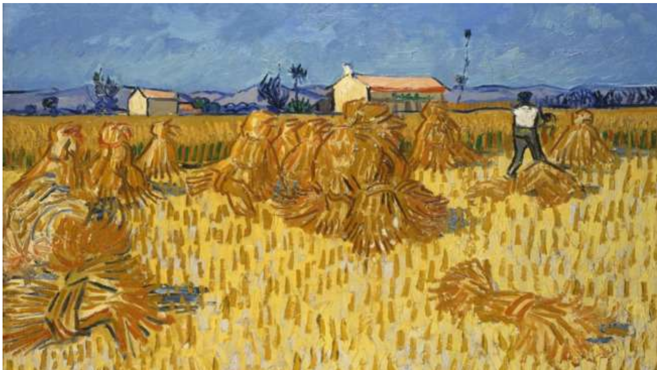
Vincent Van Gogh, Récolte en Provence, 1888, huile sur toile, 50 x 60 cm, Israel Museum