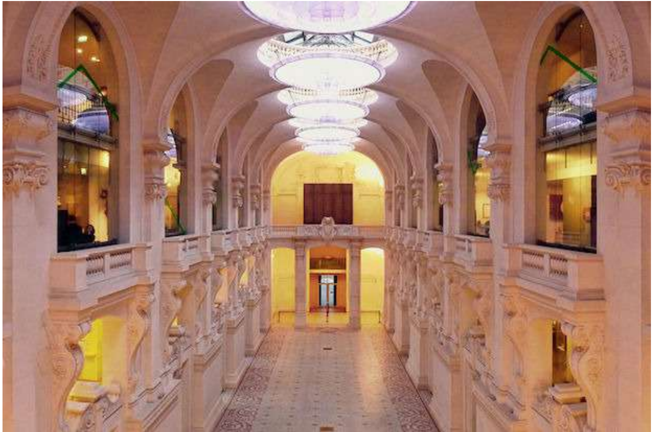
Le musée des Arts décoratifs de Paris donne un aperçu de la mode au XIXe siècle.

Google Arts & Culture recèle non seulement de peintures et de sculptures, mais également d'expositions de mode. En collaboration avec le musée des Arts décoratifs, « La mode au XIXe siècle » retrace l'histoire des vêtements féminins et masculins avant, pendant et après la révolution industrielle.