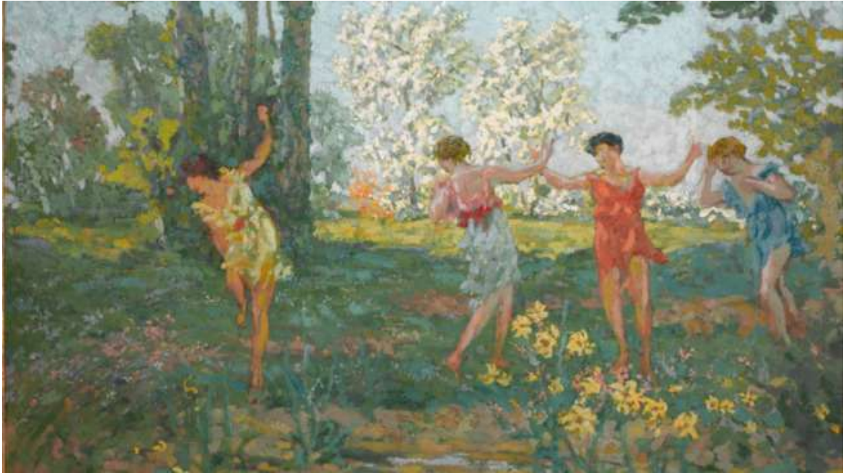
Ker-Xavier Roussel (1867-1944), Eurydice mordue par un serpent, vers 1913, huile sur toile, 113 x 161 cm, collection particulière