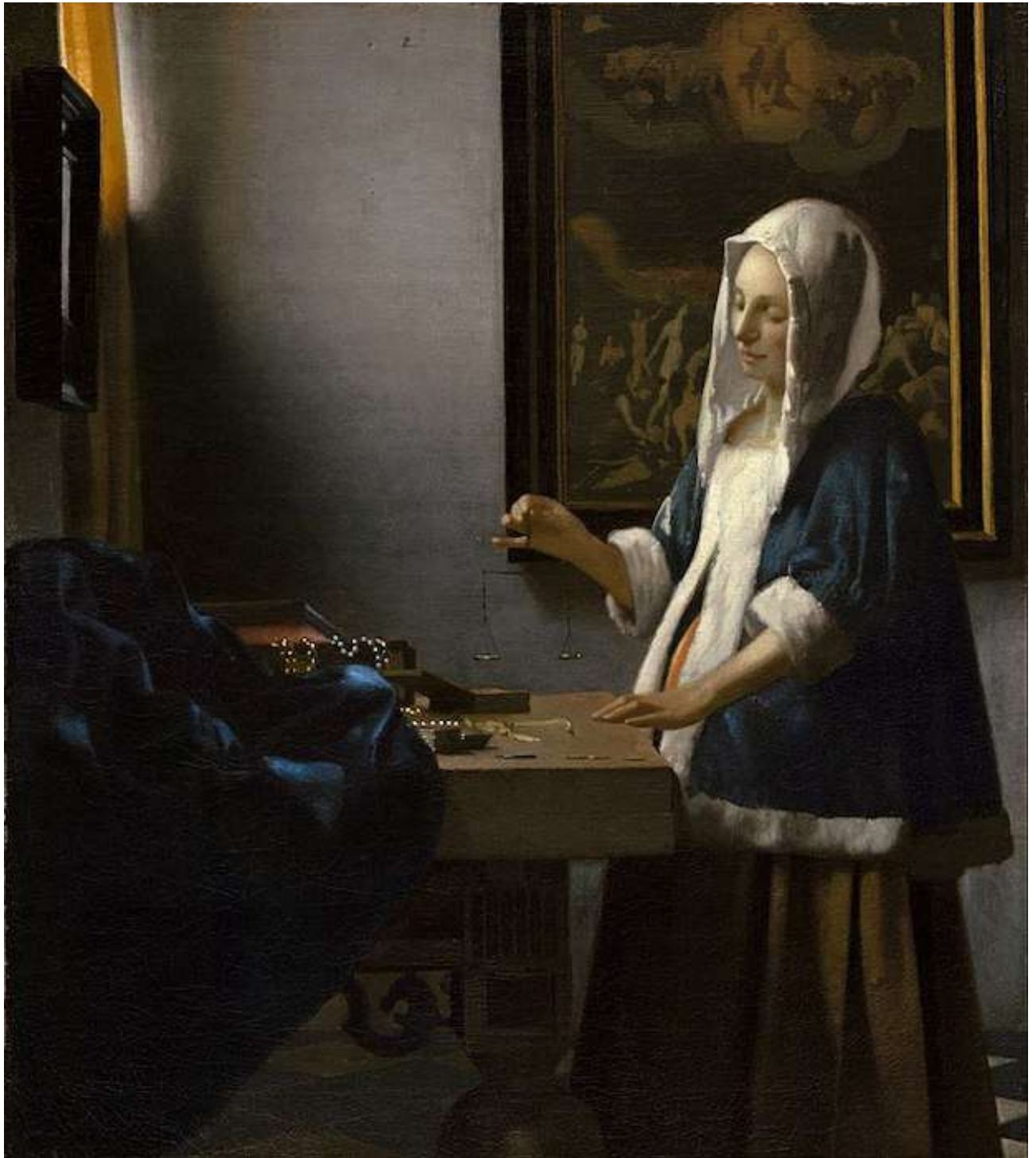
Johannes Vermeer, Femme à la balance, vers 1664, huile sur toile, 397 x 355 mm, National Gallery of Art, Washington

néerlandais. Johannes Vermeer , Gerard ter Borch, Gerrit Dou, Frans van Mieris, Gabriel Metsu... Tous les maîtres néerlandais ont su réaliser ces portraits raffinés tout en y laissant leurs propres caractéristiques artistiques.